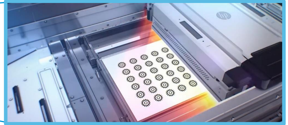
HP Jet Fusion 500&300 3D Printer

HP Jet Fusion 3D Printing 방식*은 Agent를 파우더의 원하는 단면에 Jetting 시킨 후 해당 영역에 열 에너지를 공급하여 용융/경화시키며 한 층 씩 적층시키는 방식으로, HP에서 해당 기술에 대한 관련 특허를 보유하고 있습니다.